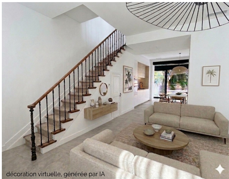
décoration virtuelle, générée par IA